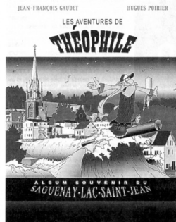
Théophile au Saguenay-Lac-Saint-Jean.

Dans chacun des cas, une fois terminés les mois de recherche nécessaires à